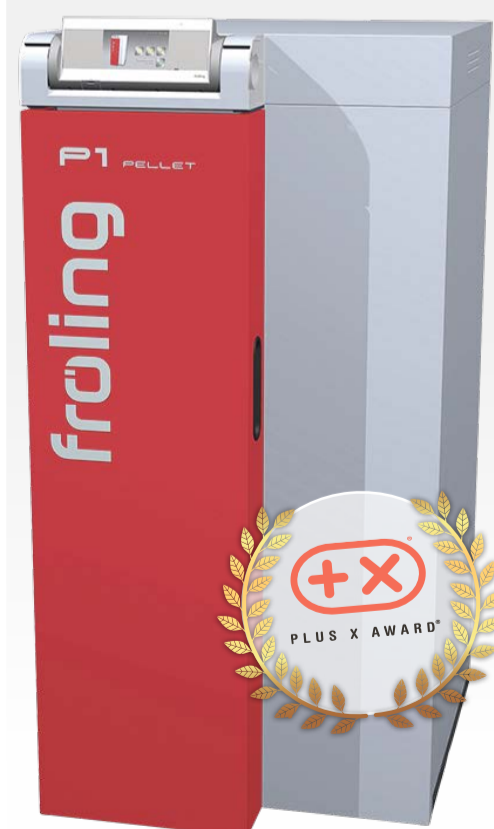
Der P1 Pellet: Die flexible Kompaktlösung für den Heizraum